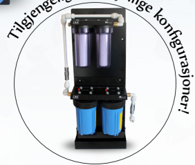
Tilgjengelig i forskjellige konfigurasjoner!